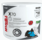
X70 LISO 30243064