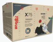
X75 EMBOZADO 30243089